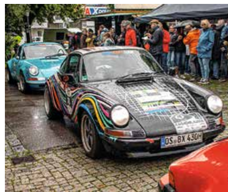
Auch einige Porsches mit besonderem Design waren mit dabei.