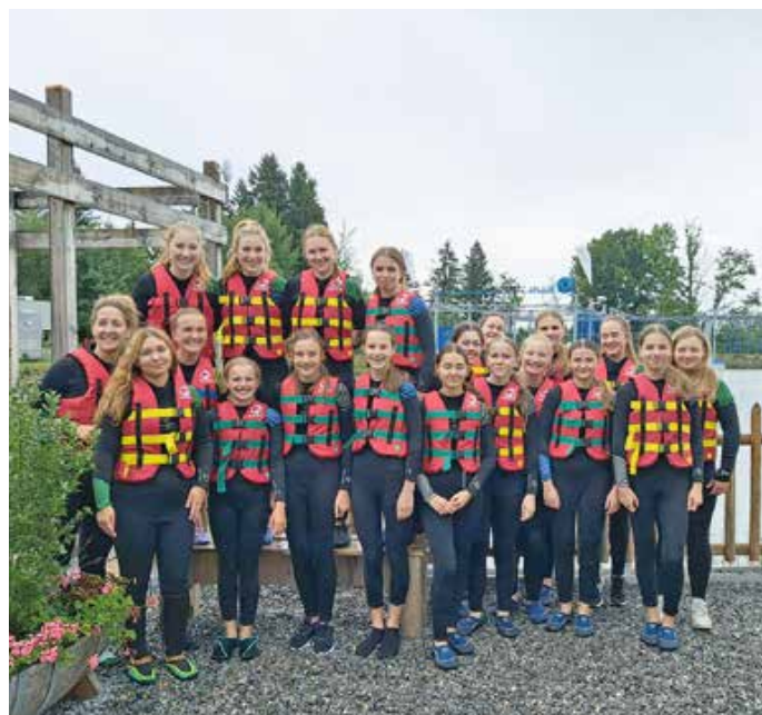
Ausflug der Korbballmädel zum Alpspitzsplash in Nesselwang.