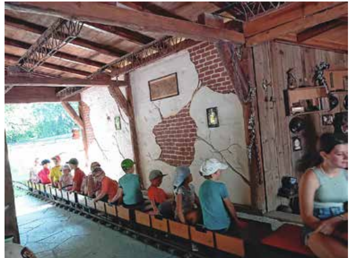
Ausflug in den Märchenwald.