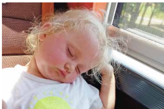
Glücklich aber müde fuhren wir wieder nach Hause.