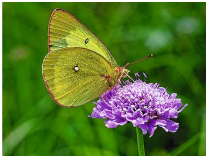
Hochmoor-Gelbling.