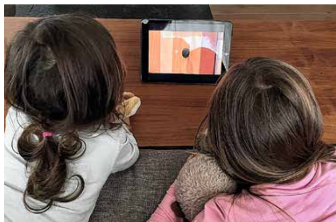
Kinder und Internet.

Das nächste VGem-Blatt erscheint am Samstag, 15. November 2025.