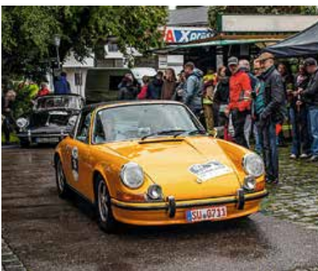
Unzählige automobilen Raritäten fahren durch Seeg.