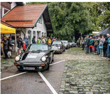
Fast 170 Porsches passieren die Durchfahrtskontrolle an der Bäckerei Jost.