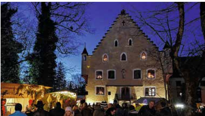
Stimmungsvolles Ambiente am Adventsmarkt in Hopferau.