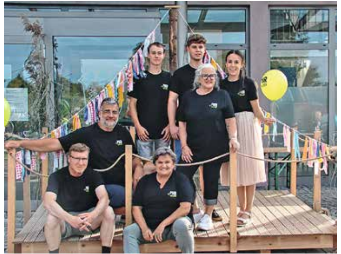
Vorstandschaft Mir Walder e.V.