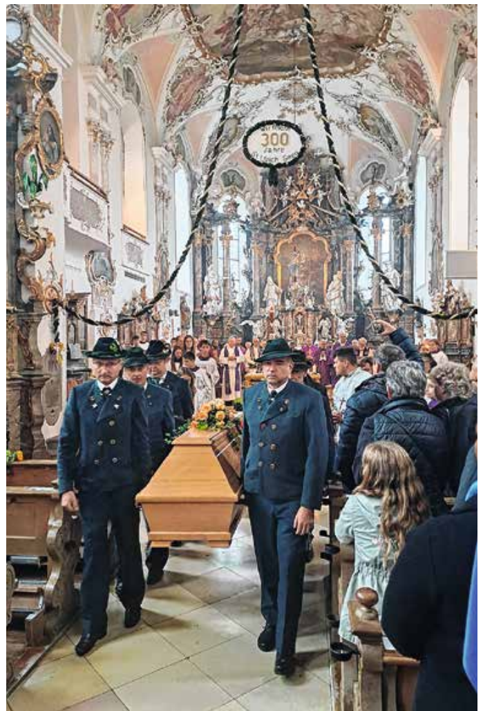
Die Bürgermeister von Schwangau und Halblech tragen den Sarg mit je einem Vertreter der drei Pfarreien, sowie der Pfarrei Seeg aus der Kirche zum Priestergrab.