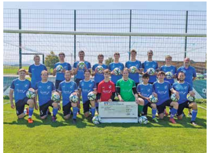
Die Fußballherren des TSV Lengenwang freuen sich über die neuen Bälle, die von der Raiffeisenbank Südliches Ostallgäu gesponsert wurden.