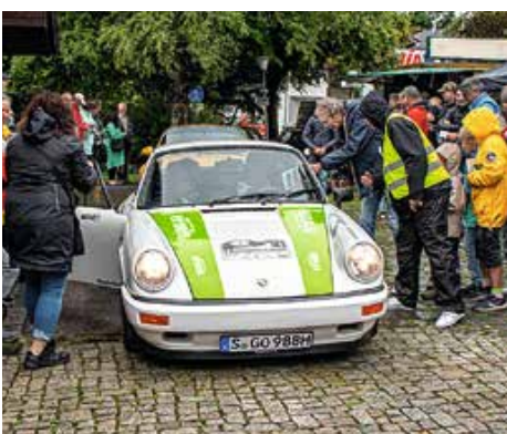
Ankunft von Walter Röhl und Christian Geistdörfer.