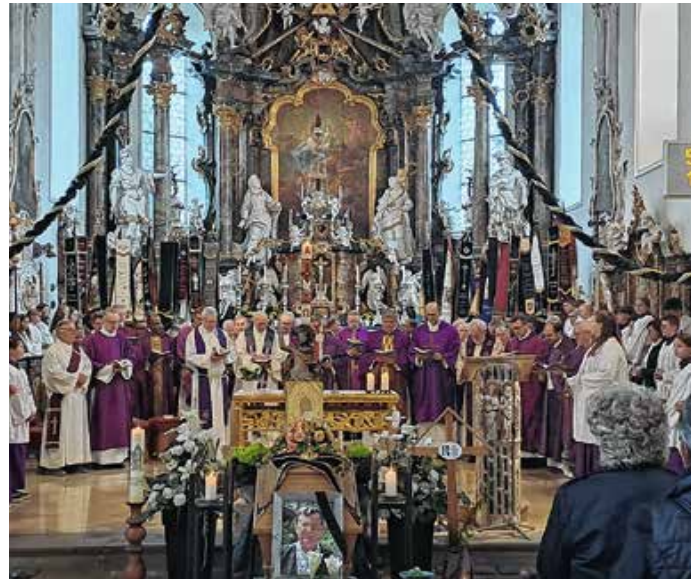
Die Geistlichen und Ministranten im Chorraum.