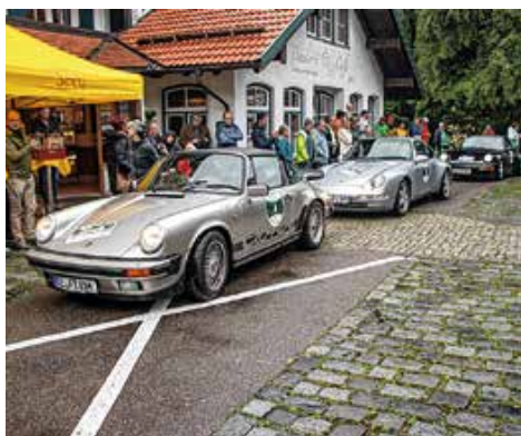
Ankunft der Porsches in Seeg.