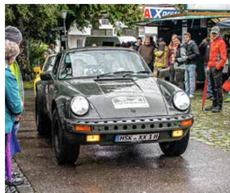
Schon mal so einen Porsche gesehen...?