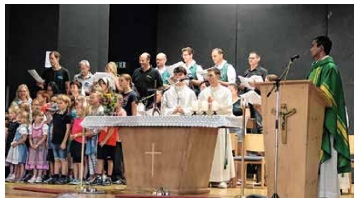
Festgottesdienst musikalisch gestaltet vom Kinder- und Kirchenchor – Fotos: Mir Walder

Landhotel Seeg, Familie von Zerboni, Wiesleutener Strasse 9, 87637 Seeg, Telefon 08364 880, info@landhotel-seeg.de, www.landhotel-seeg.de