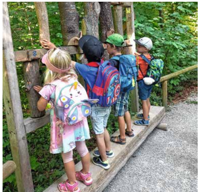
Es gab viele interessante Dinge zu entdecken.