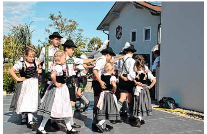
Die Trachtenjugend zeigte ihr Können.