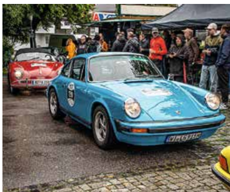
Bunte Porsches hellen den Tag ganz besonders auf.