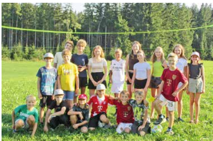
Die Rückholzer Minis beim Zelten.