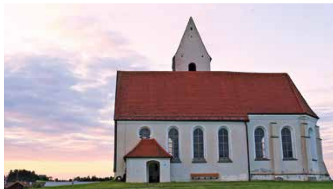
Die Sankt Anna Kirche in Kirchthal.