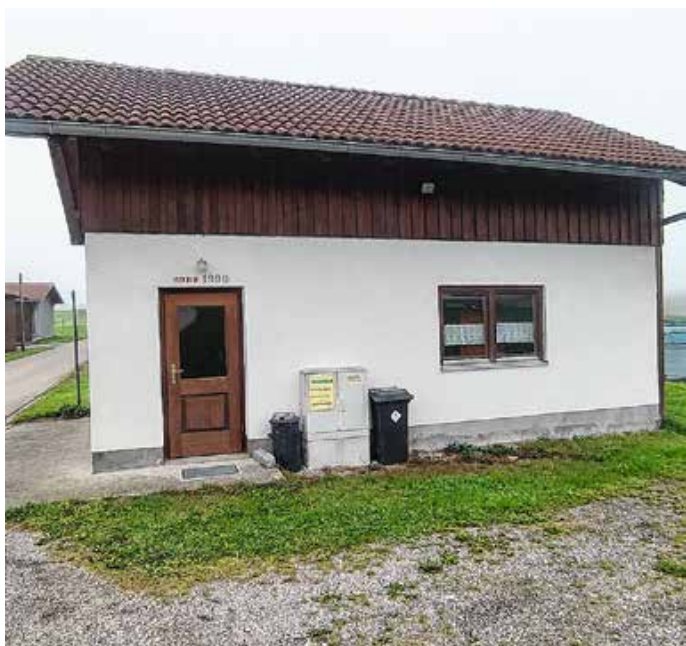
Die Sammeltonne am Feuerwehrhaus Enisried steht bereit.