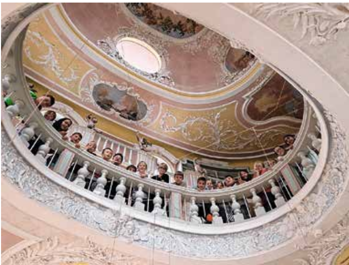
Ausflug zum Stadtmuseum Füssen.