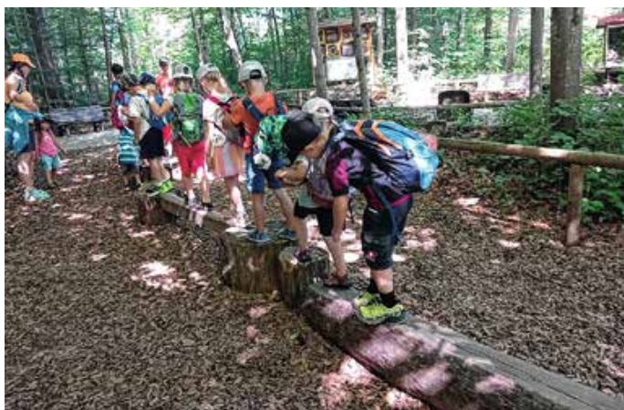
Auch die Bewegung kam nicht zu kurz.