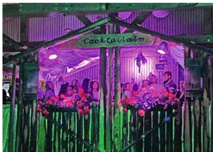
Hüttengaudi in Seeg.