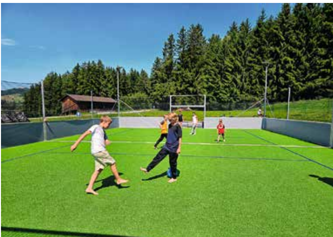
Ausflug zum Soccer-Court Eisenberg.