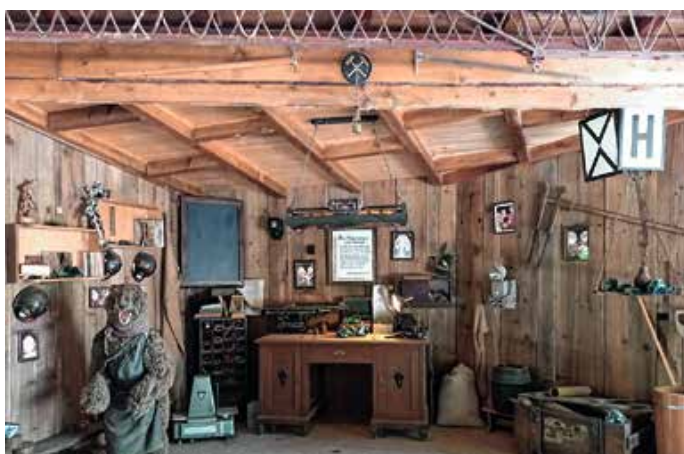
Wilde Tiere waren zu sehen.