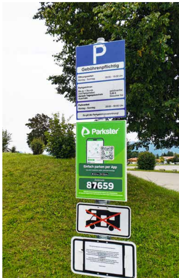
Parkplatz Hopferau Auenhalle.