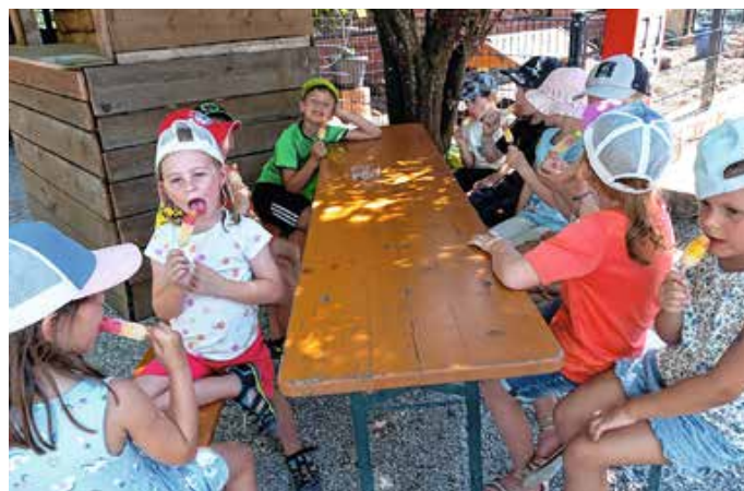
Zur Stärkung gab's ein Eis.