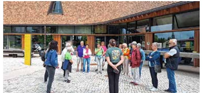
Rapunzel Welt Legau.