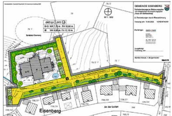
Planentwurf des Vorhabenbezogenen Bebauungsplans für das Wohnprojekt Betreutes Wohnen „Haus am Schlossberg“. — Copyright: Stadtplanungsbüro „stadtundland“

„An der Leiten“ und westlich des Schlossbergwegs. Dort soll nun Baurecht geschaffen werden. Aus diesem Grund beriet der Gemeinderat in seiner jüngsten Sitzung über eine Änderung des Flächennutzungsplans und den Entwurf eines vorhabenbezogenen Bebauungsplans.