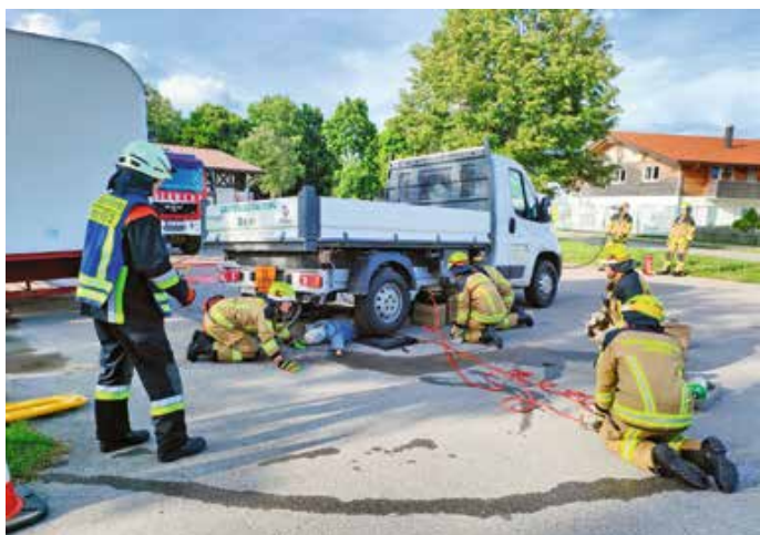
Die Prüflinge der Seeger Feuerwehr mussten knifflige Aufgaben meistern.