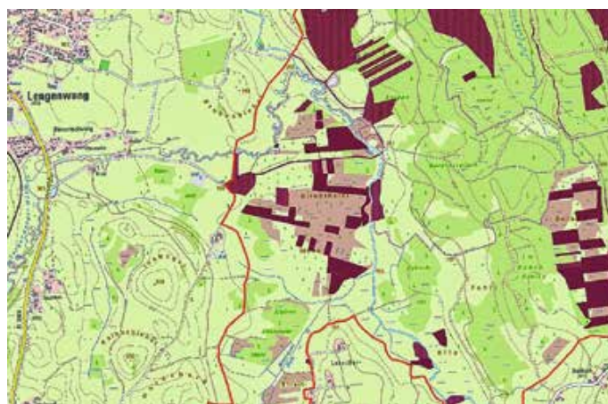
Kirchthaler Moos mit Flächen in öffentlicher Hand (dunkelrot). Maßstab 1:10.000 Rote Linie = Grenze des Projektgebiets der Allgäuer Moorallianz.