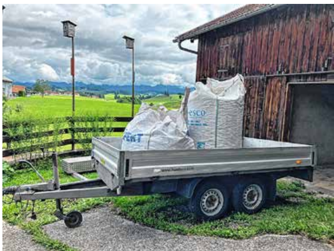
400 kg Kronkorken auf einem Anhänger.