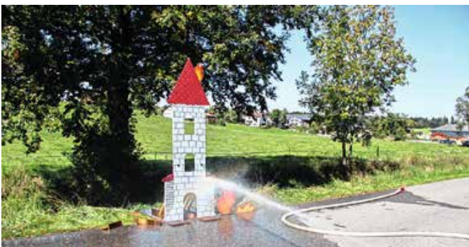
Station der Freiwilligen Feuerwehr Wald.