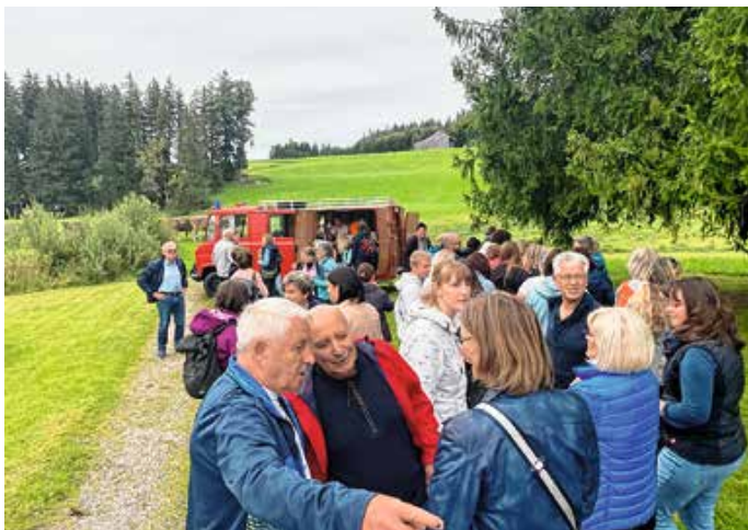
Überraschungsspaziergang zum Lengenwanger Badeplatz.