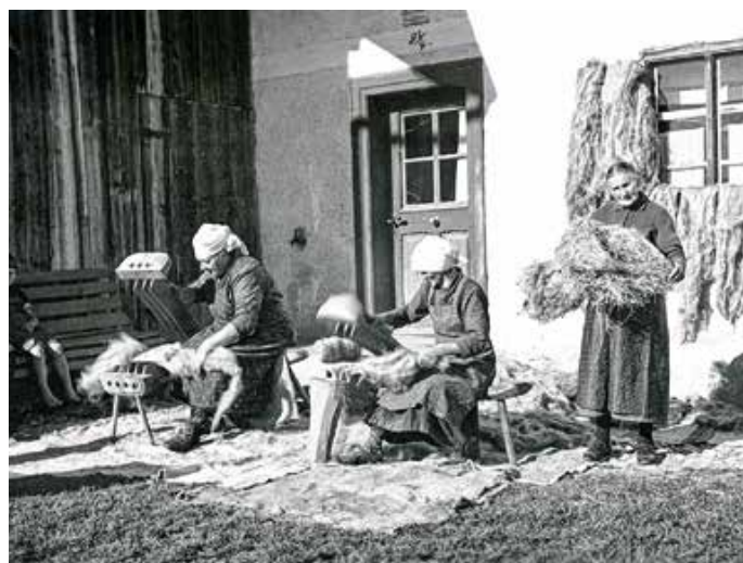
„Seeg – früher und heute“. — Foto: Leonhard

Von: Museumsverein Seeg e. V. – Matthias Weber