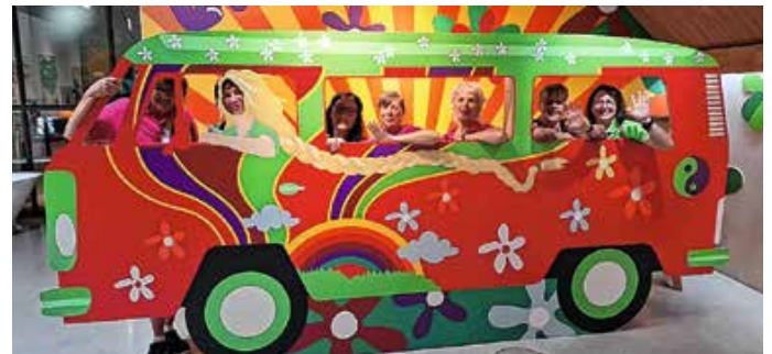
Wilde Fahrt im Rapunzel-Bus.