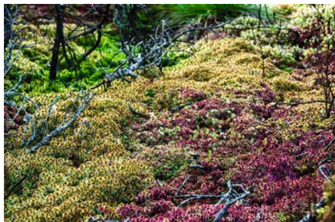
Typische Torfmoose breiten sich nach Wiedervernässungsmaßnahmen im Moor wieder aus.