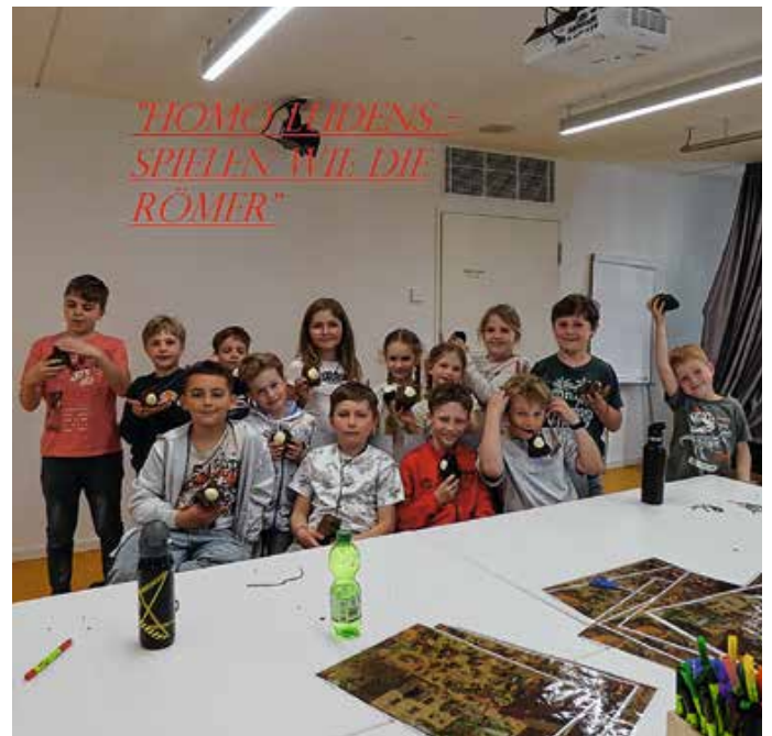
Besuch im Museum Kempten.