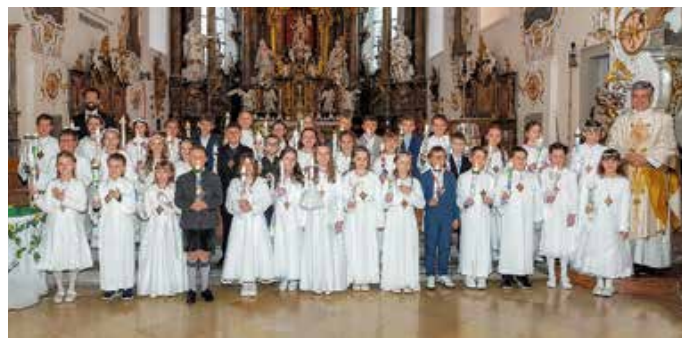
Erstkommunion in Seeg.