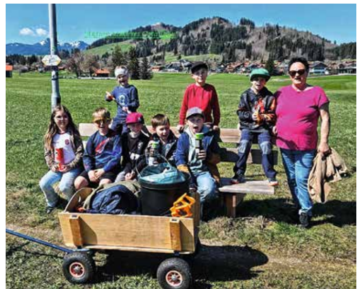
Aktion „Sauberes Ostallgäu“.

Anzeigen informieren. Aus der Region – für die Region. Immer aktuell.