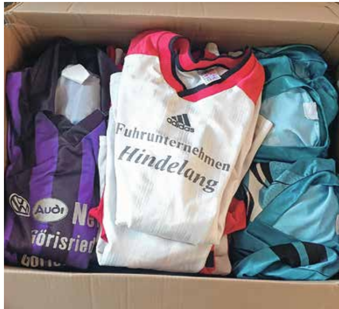
Fertig gepackte Trikots.

Wir freuen uns, dass unsere 19 Trikotsätze bald irgendwo auf der Welt im Einsatz sind! Von: Sandra Trzaska und Vera Dopfer