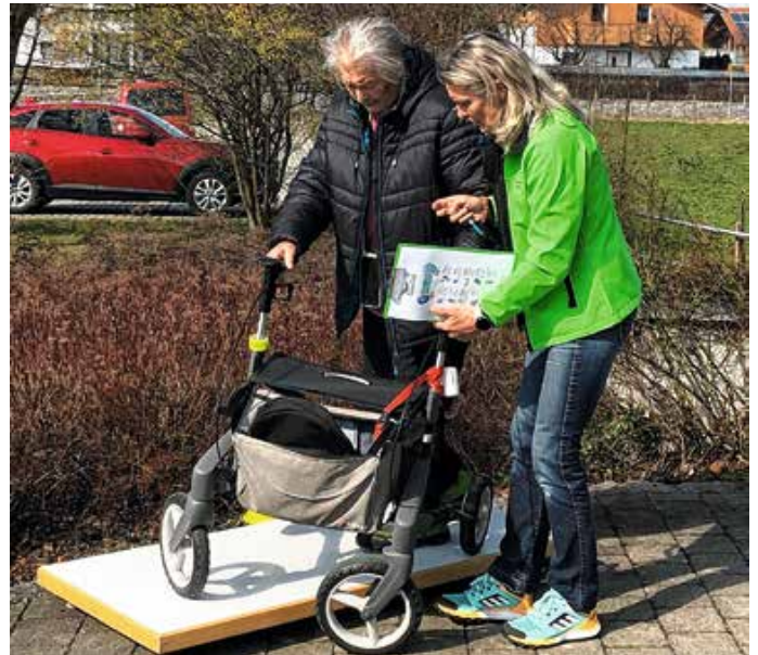
Problemlos Hindernisse überwinden – das war auch ein Thema der ersten Rollatorschulung in Lengenwang.