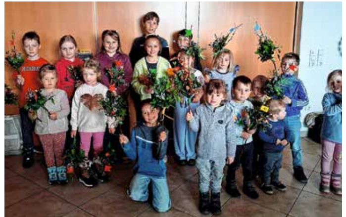
Freude über die Palmboschen. – Fotos: Christa Osterried