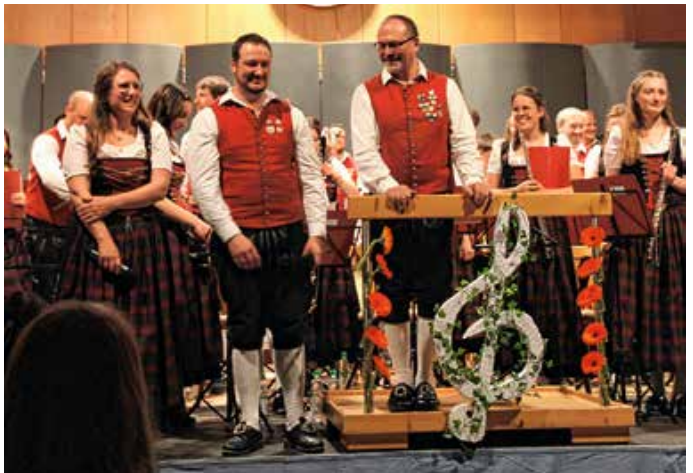
20 Jahre Konzert in der Schul-Turnhalle Lengenwang. – Fotos: Gwendolin Sieber