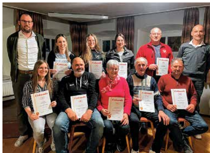
Die Geehrten.