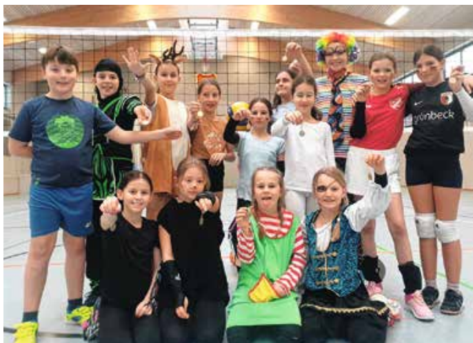
Die U-14 mit ihren Sportabzeichen.

Die älteren Kinder haben durch fleißiges Training schon alle Abzeichen geschafft. Für die Jüngern ist das Abzeichen eine große Motivation, ihre Technik weiter zu verbessern. Von: Vera Dopfer