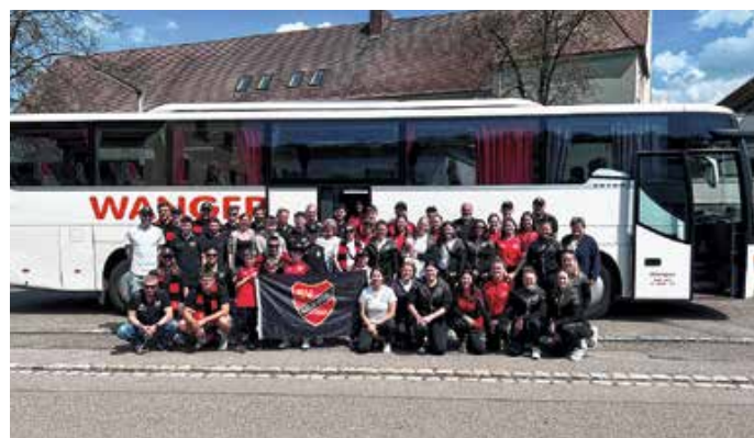
Die mitgereisten Fans.