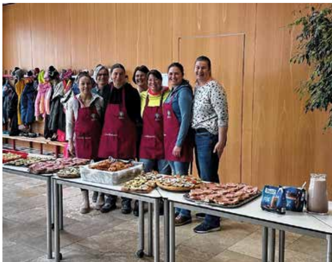
Allerlei Köstlichkeiten haben die Landfrauen gezaubert.