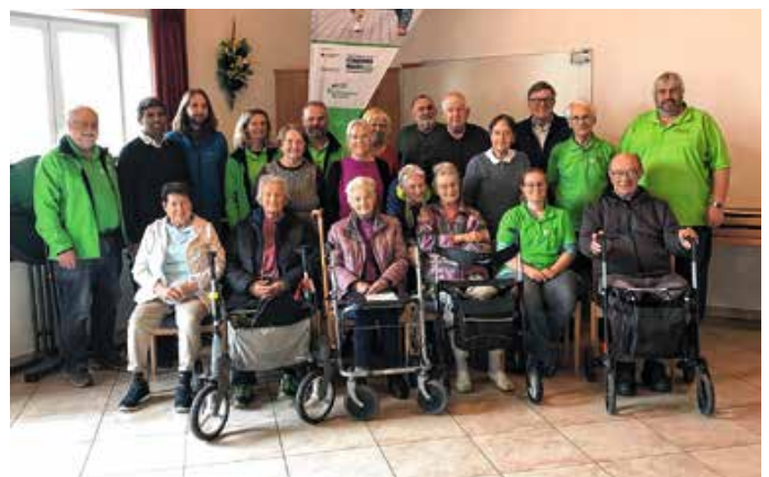
Das Gruppenfoto der Teilnehmer der ersten Rollatorschulung in Lengenwang.