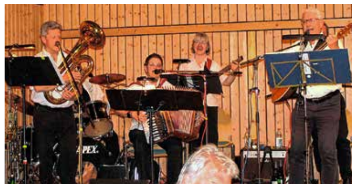
Die Gruppe MOD-SE, die für Stimmung am Festabend sorgte.