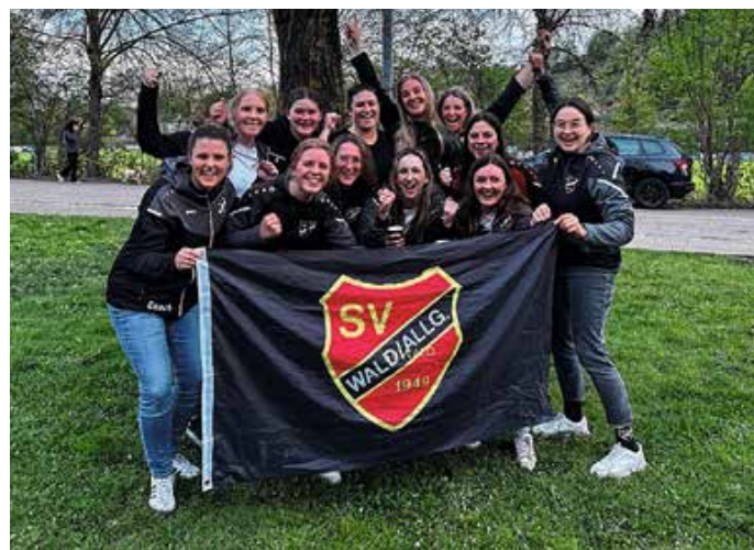
Die Volleyball-Damen I.