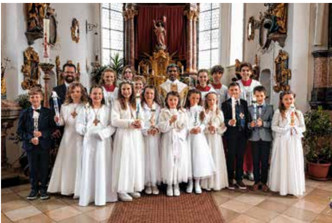
Erstkommunion Rückholz.