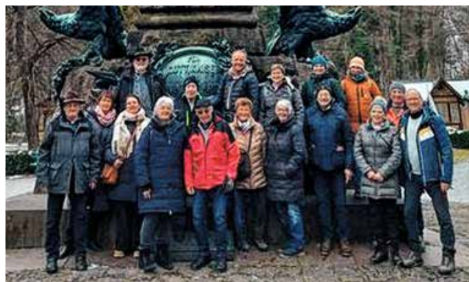
Der Kirchenchor Hopferau am Denkmal von Andreas Hofer in Innsbruck.