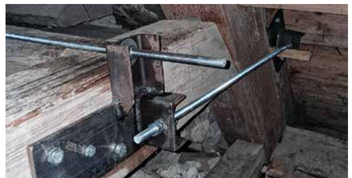
Eisenkonstruktion im Dachstuhl.