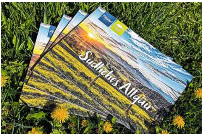
Imagebroschüre der Tourismusgemeinschaft „Südliches Allgäu“.

Die Tourismusgemeinschaft „Südliches Allgäu“, bestehend aus den Orten Eisenberg, Hopferau, Rieden, Roßhaupten und Rückholz, präsentiert ihre neu aufgelegte Imagebroschüre. Mit eindrucksvollen Bildern und abwechslungsreichen Einblicken vermittelt sie die besondere Atmosphäre der Region und macht Lust auf einen Besuch. In Zusammenarbeit mit der Agentur Eselsohr ist somit ein abwechslungsreicher Prospekt entstanden. Gastgeberinnen und Gastgeber können die Broschüre ab sofort in den jeweiligen Tourist-Informationen abholen. Von: Johannes Haf