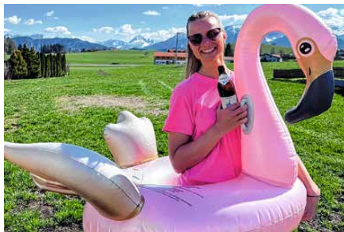
Malleparty 2.0 im richtigen Outfit.