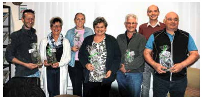
Die ausscheidenden Ratsmitglieder.