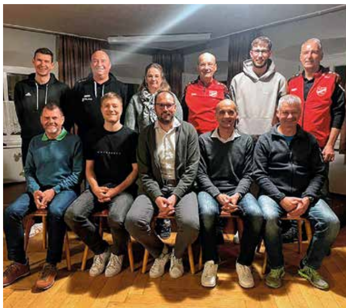
Die Vorstandschaft des SV Wald.