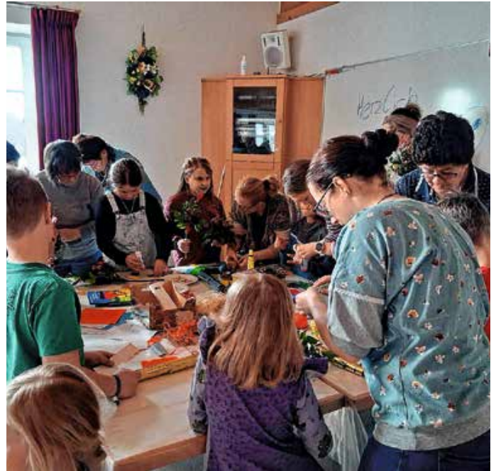
Mit Eifer dabei.