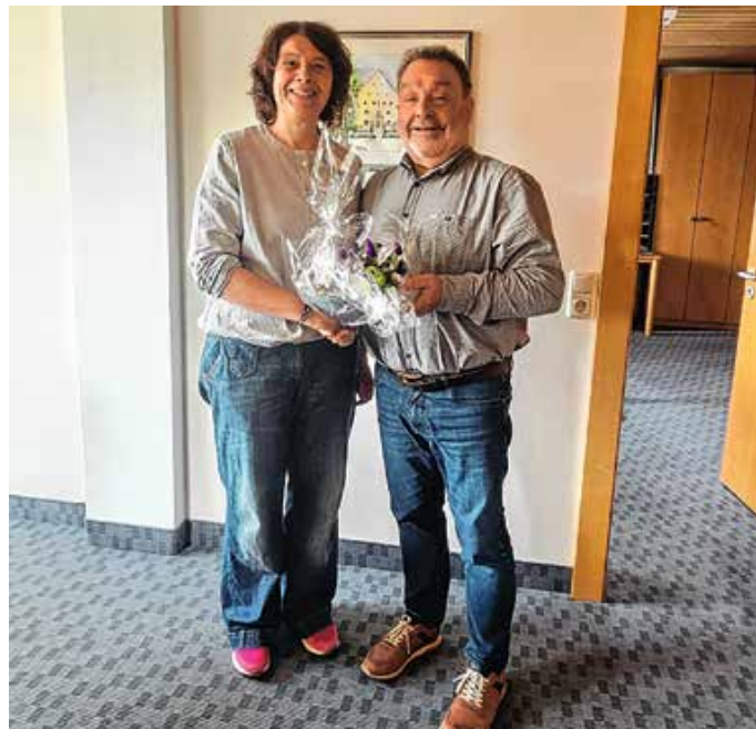
Dankesworte für 25 Jahre Engagement in der Tourist-Info Hopferau.