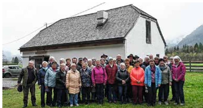
Die Teilnehmenden am Pfarrausflug St. Martin Hopferau.