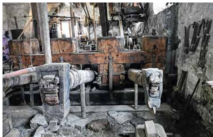
Die Hammerschmiede in Vils.