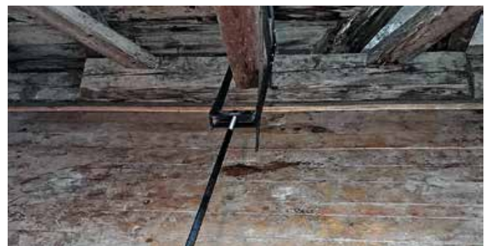
Sicherung des Dachstuhls.