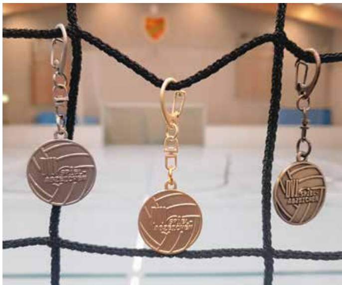
Die drei Sportabzeichen. – Fotos: Sandra Trzaska