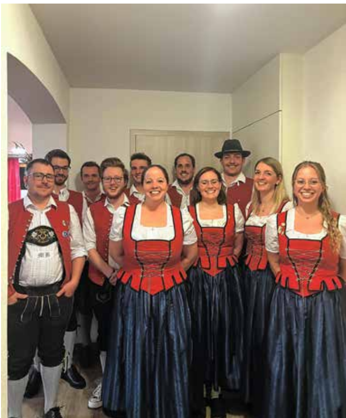
Die Vorstandschaft des Musikverein Hopferau.