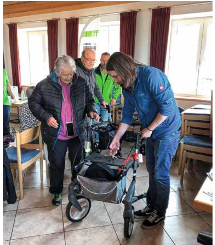
Ein Rollatorcheck gehörte ebenfalls zum Angebot.