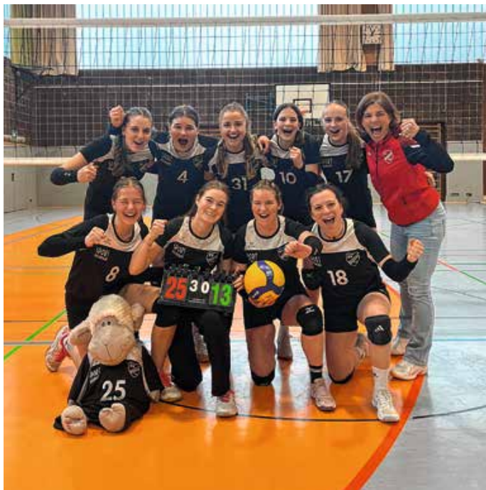
Meister Damen-Kreisklasse Süd.

Ein großes Dankeschön geht außerdem an Trainerin Sandra, die das Team die gesamte Saison über begleitet, motiviert und zu diesem großartigen Erfolg geführt hat. Von: Lena Vogler