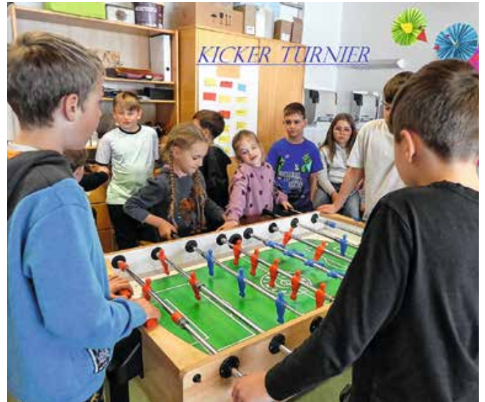
Kicker-Turnier im Kinderhort Miteinander.

Den Abschluss der Osterferien krönte ein Ausflug zum Museum Kempten mit Führung und anschließendem Workshop „Homo ludens – Spielen wie die Römer“ jedes Kind stellte einen Ledergeldbeutel selbst her. Von: Sabine Weller-Schäfer