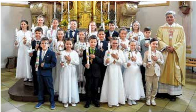
19 Kinder aus Lengenwang feierten am 19. April 2026 ihre Erstkommunion.