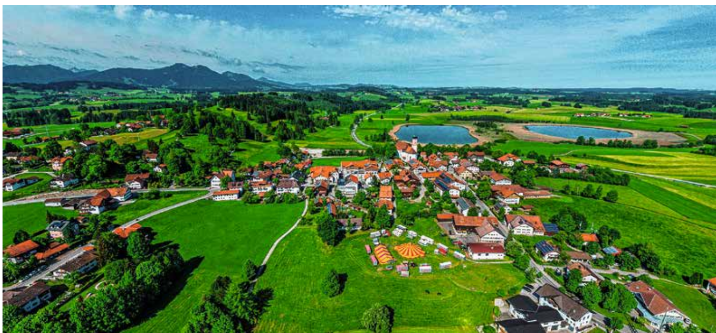
Ausblick auf den Luftkurort Seeg im Allgäu.

Der Redaktions- und Anzeigenschluss für das VGem-Blatt vom 15. Mai 2026 ist Mittwoch, 22. April 2026, 12 Uhr.