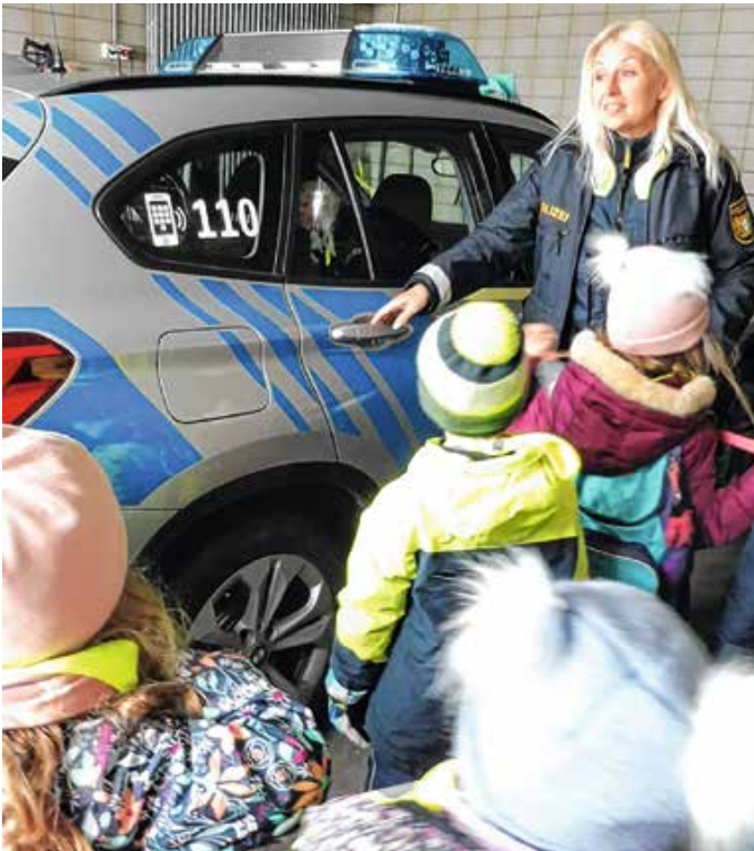
Wie funktioniert das Blaulicht am Polizeiauto?