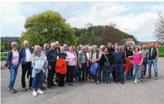
Die Teilnehmenden des Gemeindeausfluges Hopferau nach Regensburg.