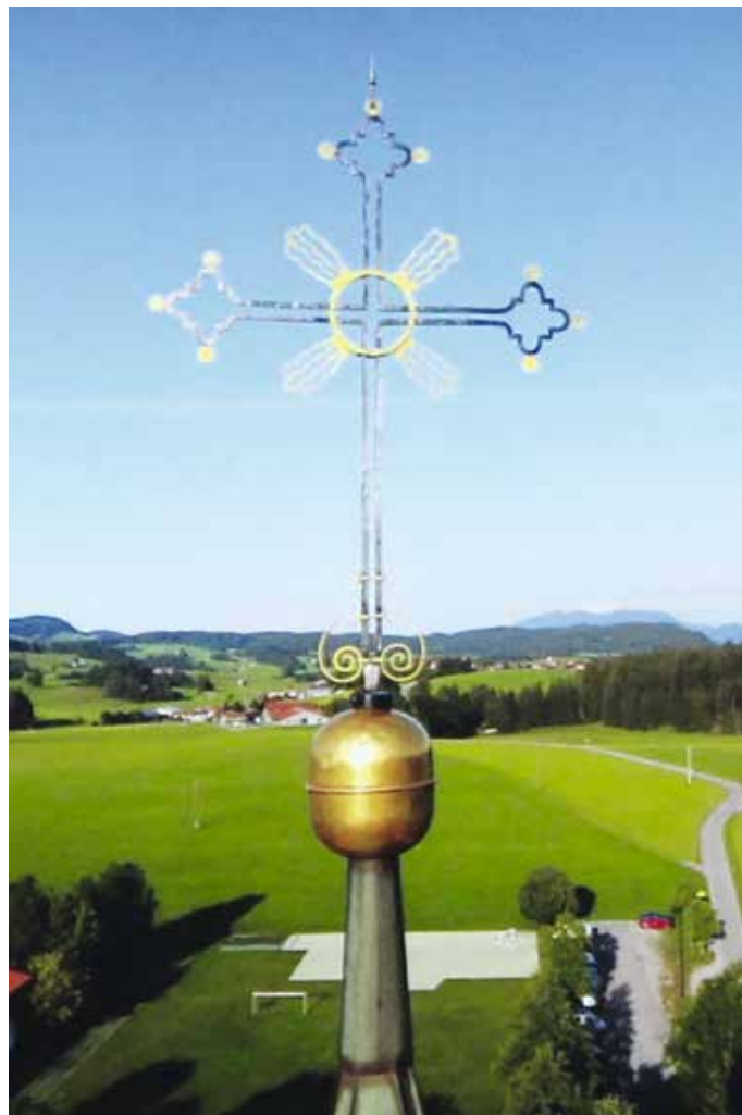
Kirchturmkugel der Wallfahrtskirche Maria Hilf.

Vor die Gerüste am Turm abgebaut werden, wird der Behälter mit neuen Daten und Meldungen von der jetzigen, grundlegenden Sanierung wieder zusätzlich bestückt, in der Kupferkugel verstaut und dann wieder aufgesetzt werden. Dies dürfte in näherer Zeit erfolgen. Wie viele Jahre sie dann wieder verschlossen bleiben wird steht natürlich in den Sternen. Von: Albert Guggemos