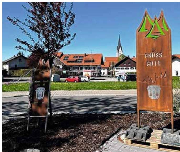
Die neue Ortseingangstafel und das Geschenk.