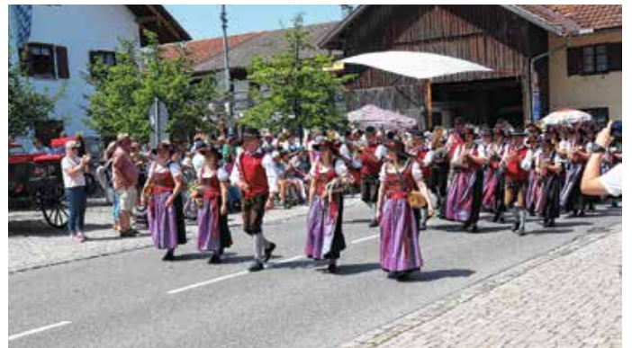
Harmoniemusik Seeg beim großen Festumzug. – Foto: S. Thiel