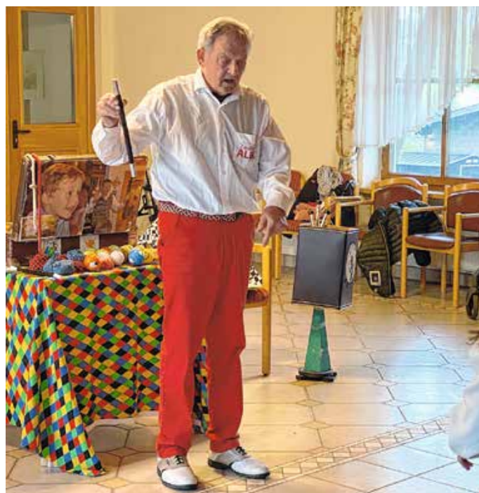
Magische Momente in der Seeger Senioren WG.

Von: Bettina Gierl, Kirchliche Sozialstation Marktoberdorf gGmbH