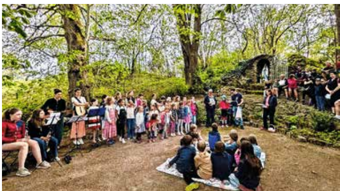
Maidandacht am Kalkofen.