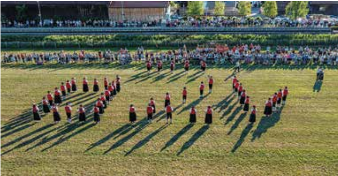
Gratulation zum 170. Vereinsjubiläum vom Musikverein Hopferau in Form einer „170“.