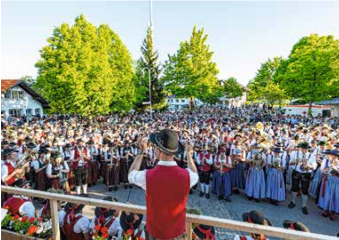
Zusammentreffen der Musikvereine nach dem Sternmarsch.