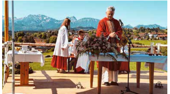
Gottesdienst auf dem Gißbüel lockt mit traumhaftem Wetter und Bergpanorama.