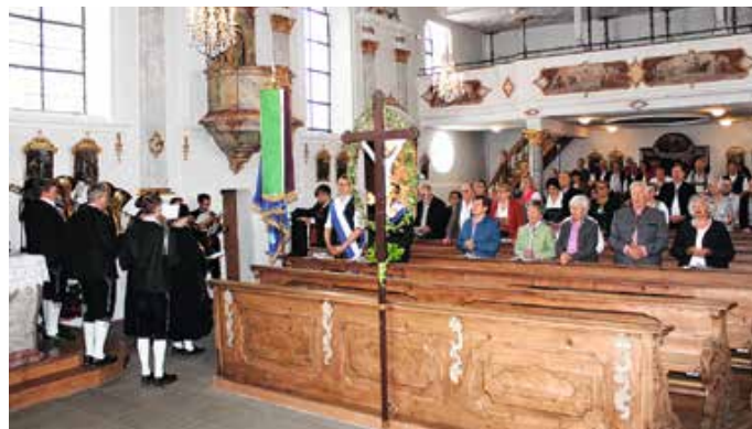
Wirtewallfahrt Gottesdienst in „Maria Hilf“.