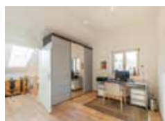
Dachausbau & serielle Sanierung in Füssen