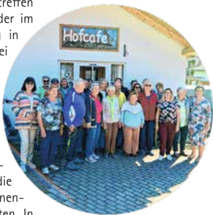
30 Mitglieder trafen sich zum VdK-Mitglieder-Treffen.

Beim jüngsten Vereinstreffen kamen rund 30 Mitglieder im Hofcafe in Lengenwang in gemütlicher Runde bei Kaffee und Kuchen zusammen. Einige Teilnehmer nutzten das schöne Wetter und reisten sogar mit dem Fahrrad an. Sonnenanbeter fanden ihren Platz auf der Terrasse, während es sich die übrigen Mitglieder im Innenbereich gemütlich machten. In angenehmer Atmosphäre wurde viel erzählt, gelacht und sich rege ausgetauscht.