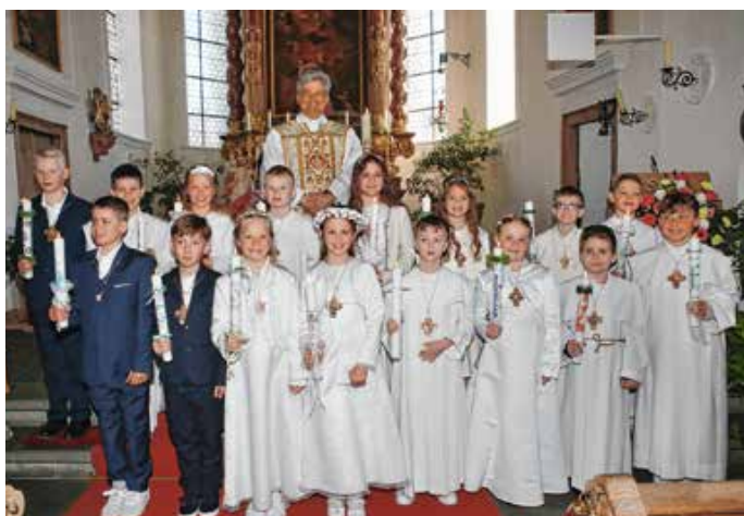
Erstkommunion in Eisenberg-Zell.