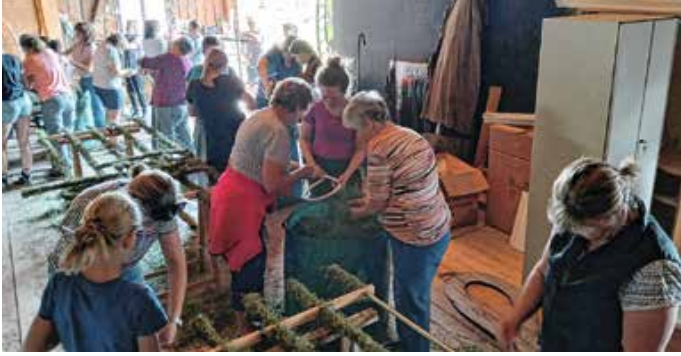
Gestalten des Festzeltschmucks fürs Bezirksmusikfest.

Was für eine gelungene Aktion! Es wurde fleißig angepackt, viel geschafft und alles mit viel Spaß! Besonders schön war zu sehen, wie viele von euch gekommen sind, um gemeinsam zu helfen, den Festzeltschmuck fürs Bezirksmusikfest zu gestalten! Egal ob zum Heubinden oder Blumenstecken – jeder einzelne Beitrag hat gezählt! Herzlichen Dank!