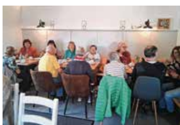
Im Hofcafe Holzheu gab es Kaffee und Kuchen.

Zum Abschluss wurde ein gemeinsames Foto angeboten, an dem ein Teil der Anwesenden gerne teilnahm, während die anderen die Zeit für unterhaltsame Gespräche nutzten. So klang das Treffen ganz im Sinne eines lebendigen und harmonischen Miteinanders aus.