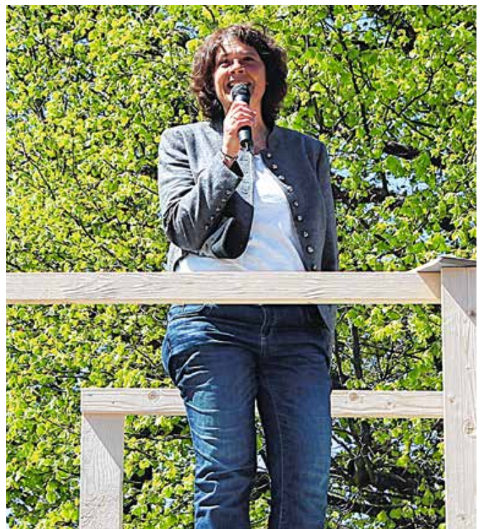
Ansprache von Eva Schabel, seit 12 Stunden Bürgermeisterin.