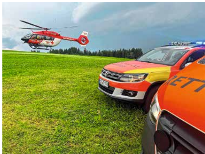
Die Retter im Einsatz.

Von: Teamleiter HVO Görirsried-Wald Valentin Peslmüller