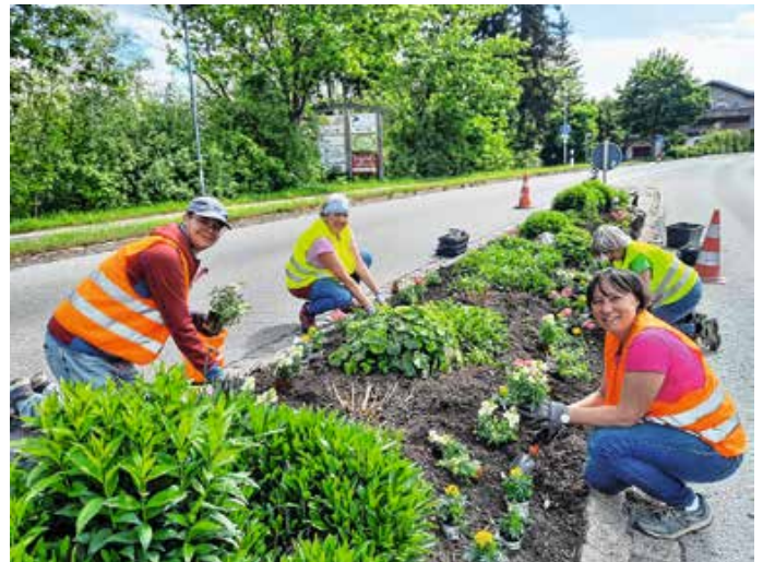
Die Mitglieder vom Blumenverein Hopferau bei der Arbeit.

Die „Kalte Sophie“ ist vorbei, und größere Nachtfröste sind nun wohl nicht mehr zu erwarten. Nach alter Gärtnerregel heißt es deshalb auch beim Hopferauer Blumenverein wieder: Ärmel hochkrepeln und loslegen. Mit viel Erfahrung, Liebe zum Detail und einem guten Gespür für harmonische Bepflanzung haben die Blumenfrauen am 18. Mai ihre Arbeit aufgenommen. Seit über 30 Jahren tragen die farbenfrohen Arrangements dazu bei, dass sich Hopferau Jahr für Jahr von seiner blühenden Seite zeigt und Einheimische wie Gäste gleichermaßen erfreuen.