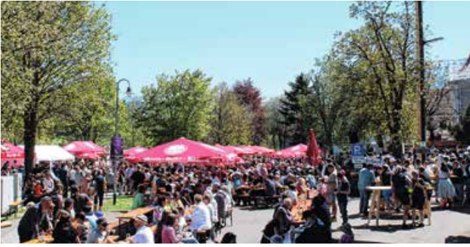
Besucheraansturm, wie es Eisenberg noch nicht oft erlebt hat.