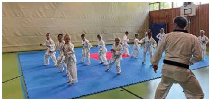
Erfolgreiche Prüflinge im Einsatz.