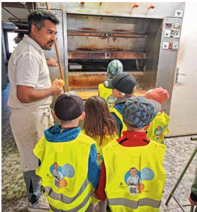
Bäckereieinhaber „Schani“ zeigt den Kindern die Backstube