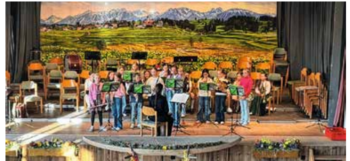
Die Bläserklasse der Christoph-von-Schmid-Grundschule

Von: Stefan Galonska, Rektor der Grundschule Seeg