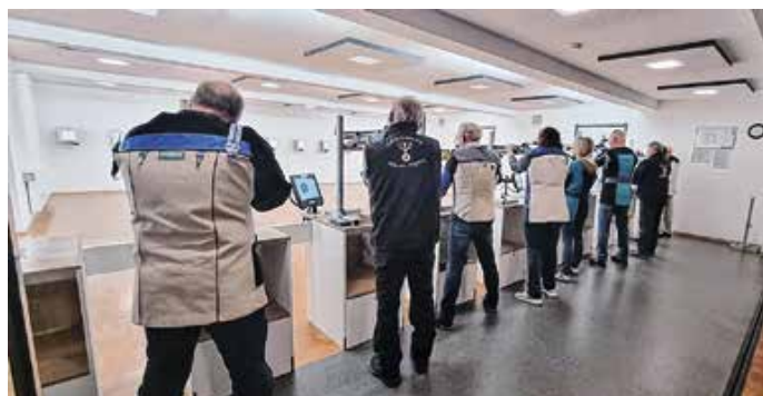
Höchste Konzentration bei den Hopferauer Aufлагeschützen.