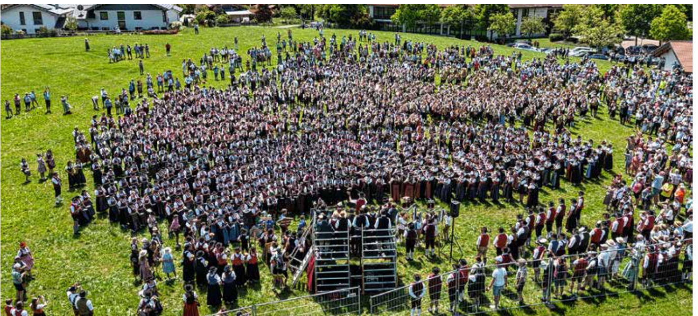
Gemeinschaftschor am Festsonntag des Bezirksmusikfests in Seeg.