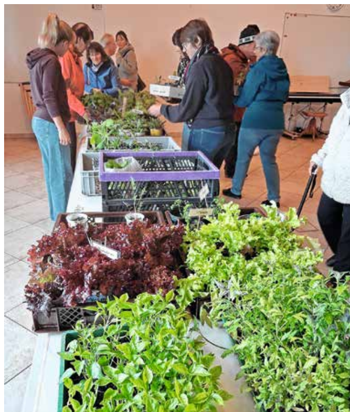
Eine Vielzahl an Gemüsepflanzen gab es bei der Pflanzenbörse.