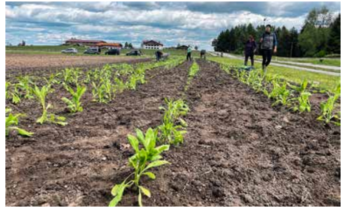
Der neu beplante Blumenacker.

Ein buntes, vielfältiges Angebot, das nicht nur das Dorf verschönert, sondern auch Insekten, Vögeln und natürlich allen Blumenfreundinnen und -freunden zugutekommt. Gemeinsam schafft man offensichtlich mehr – und dieses Projekt zeigt eindrucksvoll, was möglich ist, wenn viele Hände zusammenhelfen. Nun heißt es Daumen drücken für gutes Wetter und dafür, dass der Hagel unseren Blütenzauber verschont. Von: Johanna Purschke