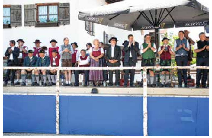
Ehrentribüne beim Festumzug.