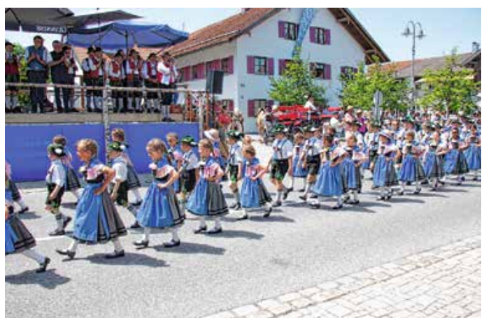
Trachtenverein D'Lobachtaler Seeg.