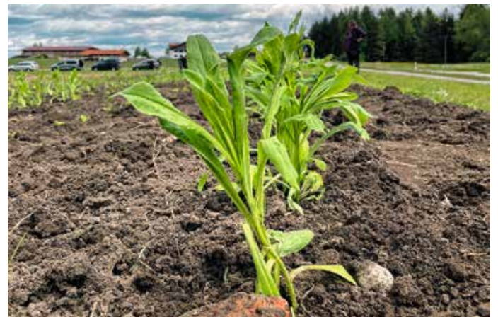
Hoffen auf gutes Wachstum. – Fotos: Walder Wildwuchs e.V.