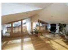
Dachausbau mit Gaube in Trauchgau