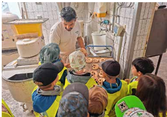
So entstehen Brezen.