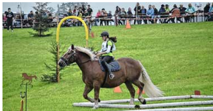
Viel Geschick Beweisen die Teilnehmer bei Turnier in Lengenwang.