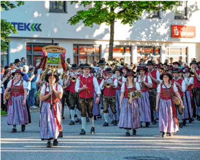
Eintreffen der Harmoniemusik Seeg beim Sternmarsch am Sammelplatz.