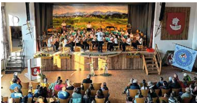
Großer Besucherandrang beim Konzert der Bläserklasse.

Dieser Moment machte deutlich, wie nachhaltig die musikalische Arbeit an unserer Schule wirkt und welche Perspektiven sich für die Kinder eröffnen. Die Begeisterung und der Applaus des Publikums sprachen für sich. Auch die Leitung der Musikschule war an diesem Abend anwesend und zeigte sich beeindruckt von der Qualität der Darbietungen sowie dem Engagement aller Beteiligten.