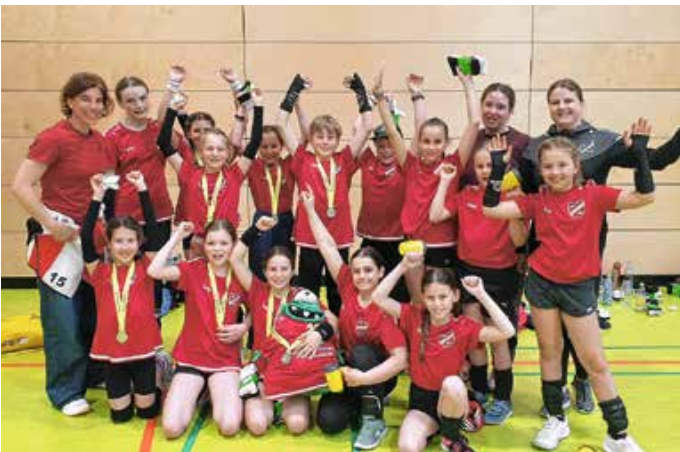
Die U14 Volleyballjugend.