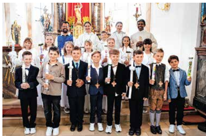
Die Erstkommunionkinder aus der Pfarrei St. Martin Hopferau.