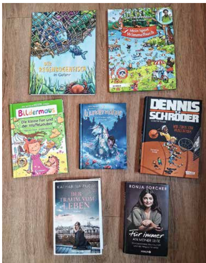
Die neuen Bücher der Seeger Bücherei.