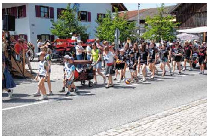
TSV Seeg-Hopferau-Eisenberg – Abt. Volleyball. – Fotos: S. Thiel