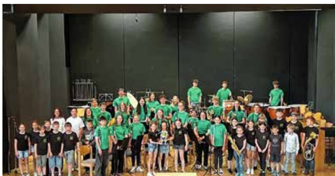
Die stolzen Jungmusiker. – Foto: Barbara Pfefferle

Der Vorspielnachmittag war damit nicht nur ein unterhaltsamer musikalischer Termin, sondern auch ein wichtiger Schritt für die jungen Talente, Bühnenerfahrung zu sammeln und ihr Selbstvertrauen zu stärken. Von: Barbara Pfefferle