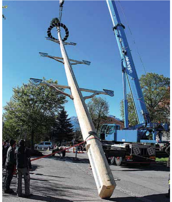
Aufstellen des Maibaumes.