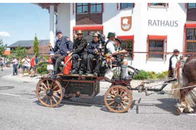
„Alte Spritze“ Freiwillige Feuerwehr Seeg.