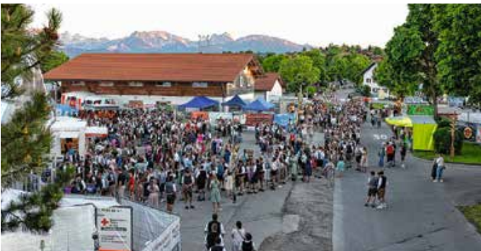
Großer Andrang beim Blasmusikfestival Abend vor dem Festzelt.