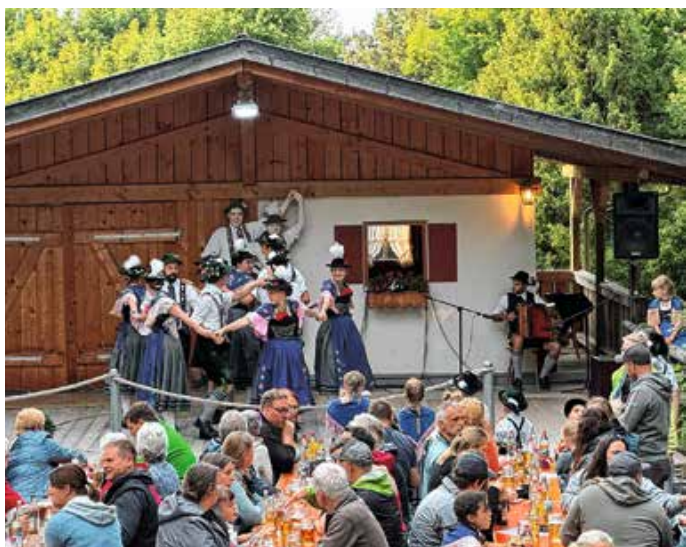
Dorfangerfest Seeg.

Der erste der drei Heimatabende findet am Dienstag, den 7. Juli um 19 Uhr statt. Die weiteren Termine sind 21. Juli und 4. August jeweils um 19 Uhr am Dorfanger. Bei schlechtem Wetter wird das Dorfangerfest auf Mittwoch verschoben. Von: Anja Feder