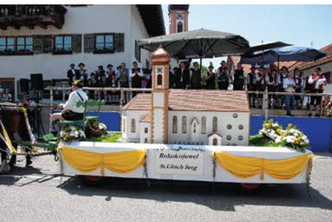
Festwagen Rokokokjowel St. Ulrich Seeg.