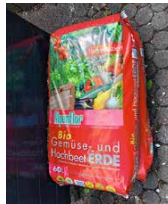
Oben links: Die eingepflanzten Pflanzen; oben rechts: Beet mit gespendeten Pflanzen; unten links: schön in Reih und Glied eingepflanzt; unten rechts: gespendete Blumenerde.