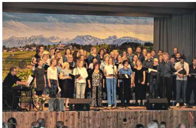
Allgäuer Pop und Jazz Chor beim Abend der Strielar.

Neben dem wunderbaren Abend, lobten viele Besucher das große Engagement der Chorgemeinschaft und die souveräne Chorleistung nach relativ kurzer Zeit des Wirkens. Auch die große Zahl der Chormitglieder aus dem ganzen Altlandkreis Füssen und aus verschiedenen Generationen, löst ein Staunen aus. Eine Sängerin sagte, jede Choreteiligung sei für sie eine Seelenwellness und ein weiterer Sänger meinte, dass der Chorleiter, mit seinem musikalischen Können, aber ganz besonders durch seine Führungskraft auf Augenhöhe, große Motivation bewirkt. Von: Seeger Strielar