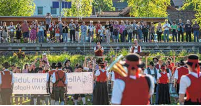
Marschmusikbewertung des Musikvereins Hopferau.