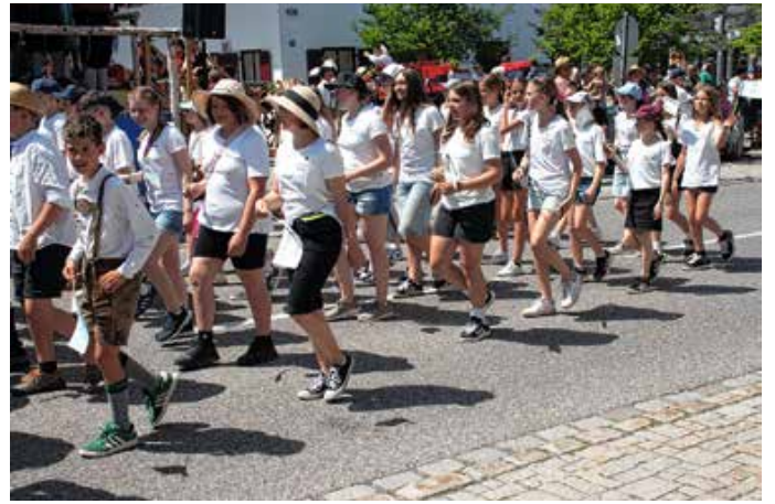
Jugendkapelle der Harmoniemusik Seeg.