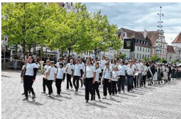
Die Juka Hopferau/Eisenberg sorgte beim Umzug für gute Stimmung und den richtigen Takt.

Der absolute Höhepunkt des Wochenendes war jedoch der große Festumzug. Tausende Zuschauer säumten die Straßen von Pfaffenhofen und applaudierten den Teilnehmern begeistert zu. Für den perfekten Rhythmus im Zug sorgte die mitgereiste Jugendkapelle Hopferau-Eisenberg, die den Umzug bravourös musikalisch begleitete und mit ihren Stücken für fantastische Stimmung am Straßenrand sorgte. Neben dem Applaus bot der Umzug den Kindern auch die perfekte Gelegenheit, über den eigenen Tellerrand hinauszuschauen.