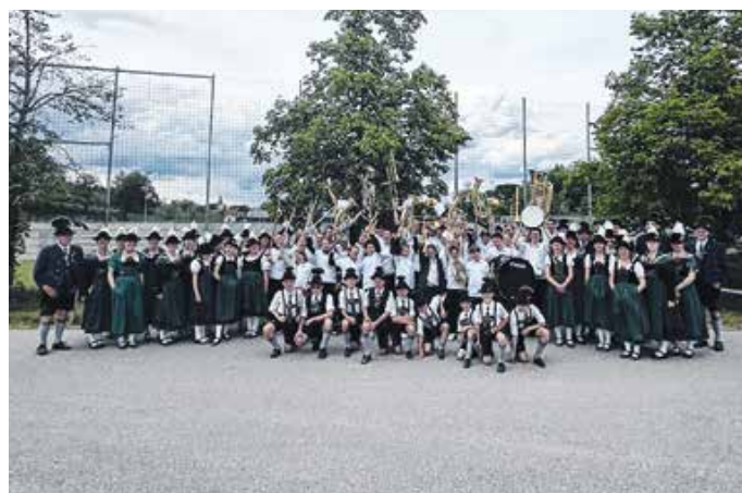
Trachtenjugend der Schloßbergler Hopferau zusammen mit der Juka Hopferau/Eisenberg.

Der Ausflug war ein voller Erfolg. Die gemeinsame Zeit, das frühe Aufstehen und das Meistern der Auftritte haben die Verbindung und den Zusammenhalt zwischen den Trachtlern und der Jugendkapelle noch einmal spürbar gestärkt. Die Jugend aus Hopferau und Eisenberg hat ihre Heimat beim Landesjugendtrachtenfest mehr als würdig vertreten! Von: Katharina Pichler