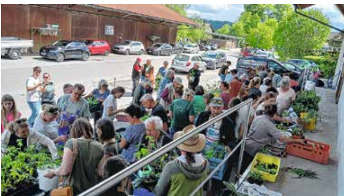
Pflanzentausch der Seeger Blumenfreunde.