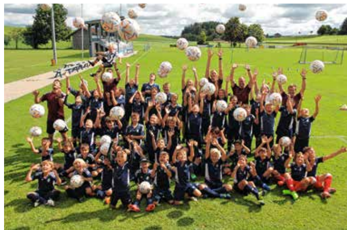
So viel Spaß hatten die Kids bei der BFV-Ferien-Fußballschule.