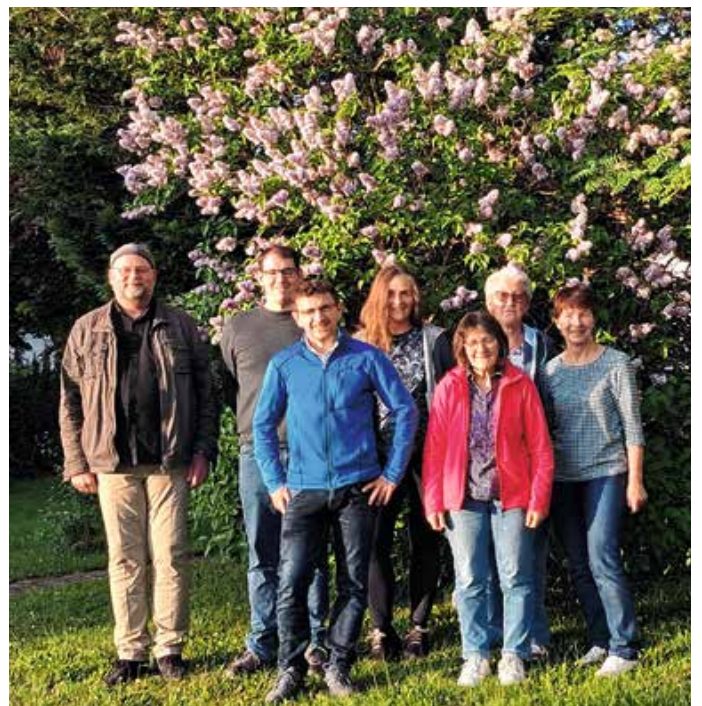
Alte und neue Vorstandschafft des Gartenbauvereins.