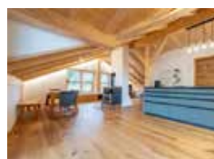
Dachausbau & Aufstockung in Pfronten