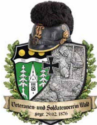
Das Wappen des Vereins.