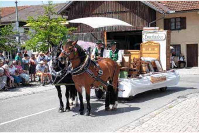
Festwagen Trachtenverein D'Lobachtaler Seeg.