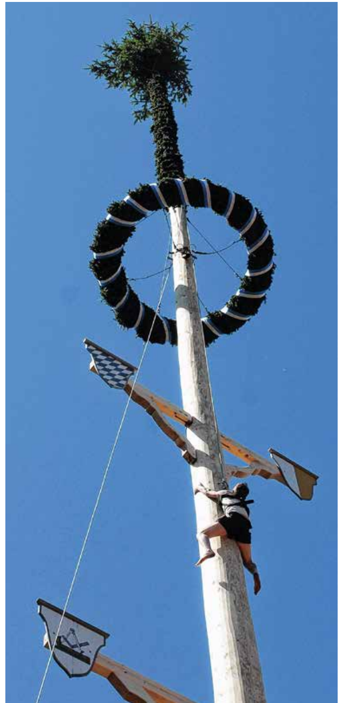
Auch drei Mädchen sind mitgeklettert.