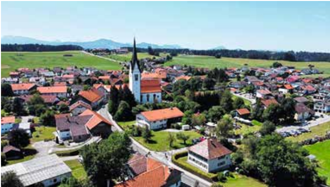
JzDorffest mit Oldtimerausstellung.

Veranstalter ist der Verein Mir Walder e.V. und die Kirchenverwaltung St. Nikolaus Wald. Von: Johanna Purschke