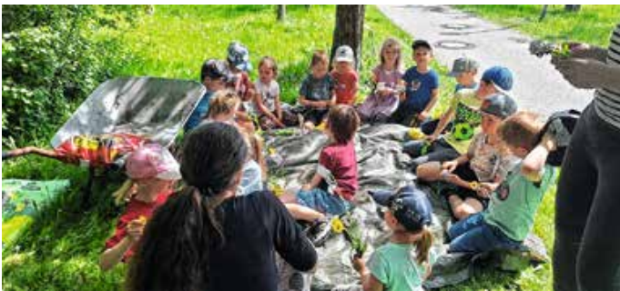
Kindertag bei den Blumenfreunden.

Wir starteten mit einer kleinen Kräuterwanderung durch den Dorfanger und lernten, welche Kräuter essbar sind – natürlich haben wir auch fleißig gesammelt. Danach durfte jedes Kind seinen eigenen Kräuterkasten bepflanzen. Zum Abschluss haben wir aus den gesammelten Kräutern leckeren Kräuterquark gemacht und ihn mit Knäckebrot genossen. Es war ein sehr gelungener Nachmittag. Wir freuen uns auf den nächsten Kindertag im Sommer.