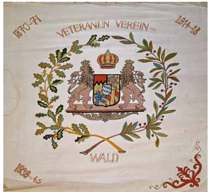
Die alte Fahne des Vereins.