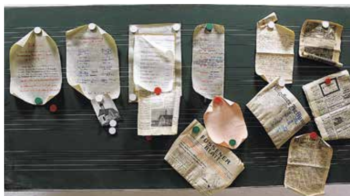
Dokumente aus der Kirchturmkugel.