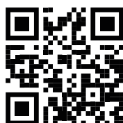
viele weitere Beispiele unter www.hauser.haus