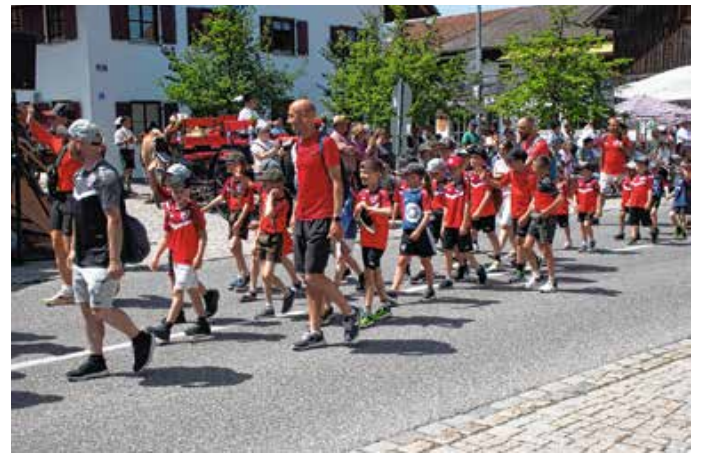
TSV Seeg-Hopferau-Eisenberg – Abt. Fußball.