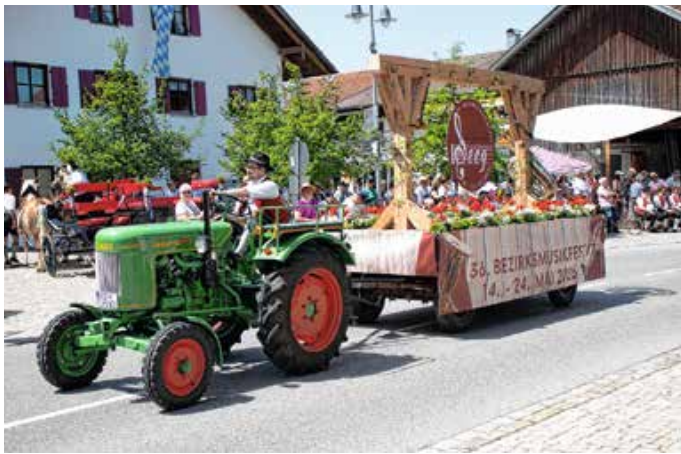
Festwagen der Harmoniemusik Seeg.