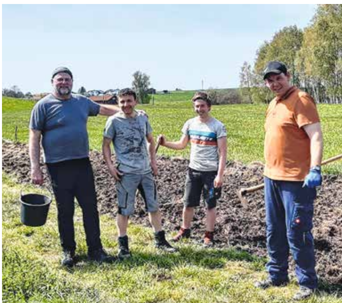
Geschafft – die Saatkartoffeln sind nun im Acker.