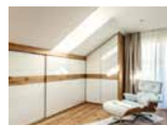
Dachausbau in Nesselwang