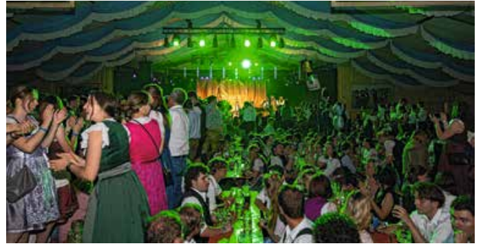
Beste Partystimmung beim Blasmusikfestival Abend im Festzelt.